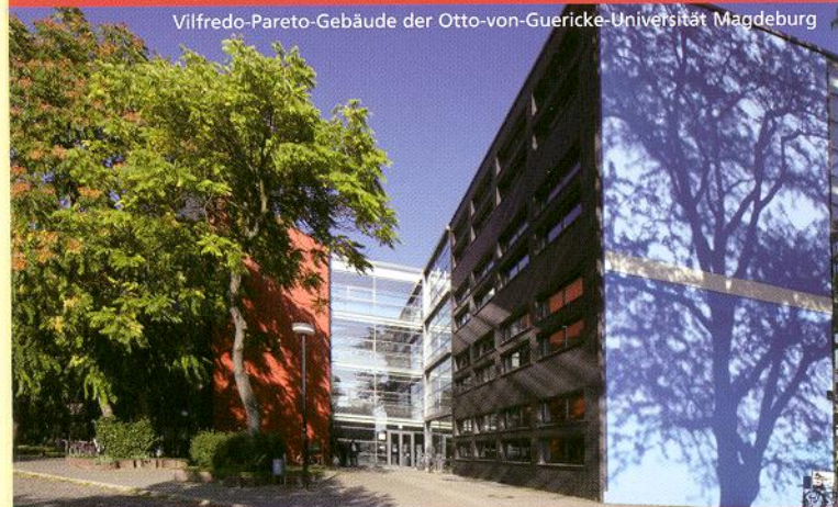
Vilfredo-Pareto-Gebäude der Otto-von-Guericke-Universität Magdeburg