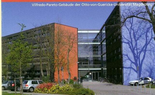
Vilfredo-Pareto-Gebäude der Otto-von-Guericke-Universität Magdeburg