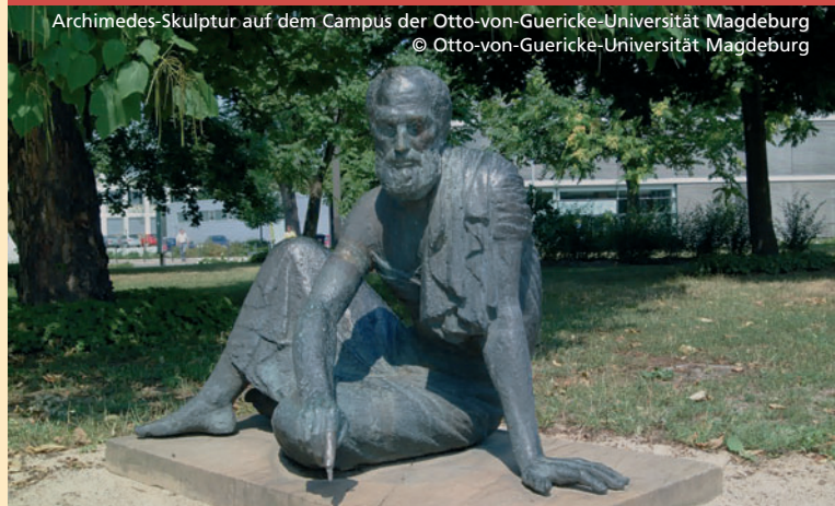
Archimedes-Skulptur auf dem Campus der Otto-von-Guericke-Universität Magdeburg